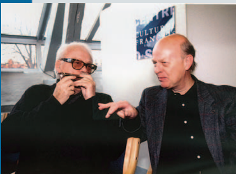
Toots Thielemans og Sigmund Groven